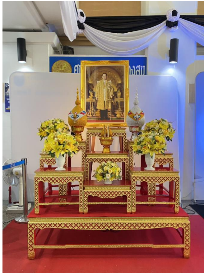
แผนปฏิบัติการส่งเสริมคุณธรรม กรมสอบสวนคดีพิเศษ ประจำปีงบประมาณ พ.ศ. ๒๕๖๘

การจัดโต๊ะหมู่บูชาเพื่อให้ข้าราชการและเจ้าหน้าที่กรมสอบสวนคดีพิเศษได้น้อมรำลึก เนื่องในวันคล้ายวันพระบรมราชสมภพพระบาทสมเด็จพระบรมชนกาธิเบศรมหาภูมิพลอดุลยเดชมหาราชบรมนาถบพิตร วันชาติและวันพ่อแห่งชาติ ๕ ธันวาคม ๒๕๖๘