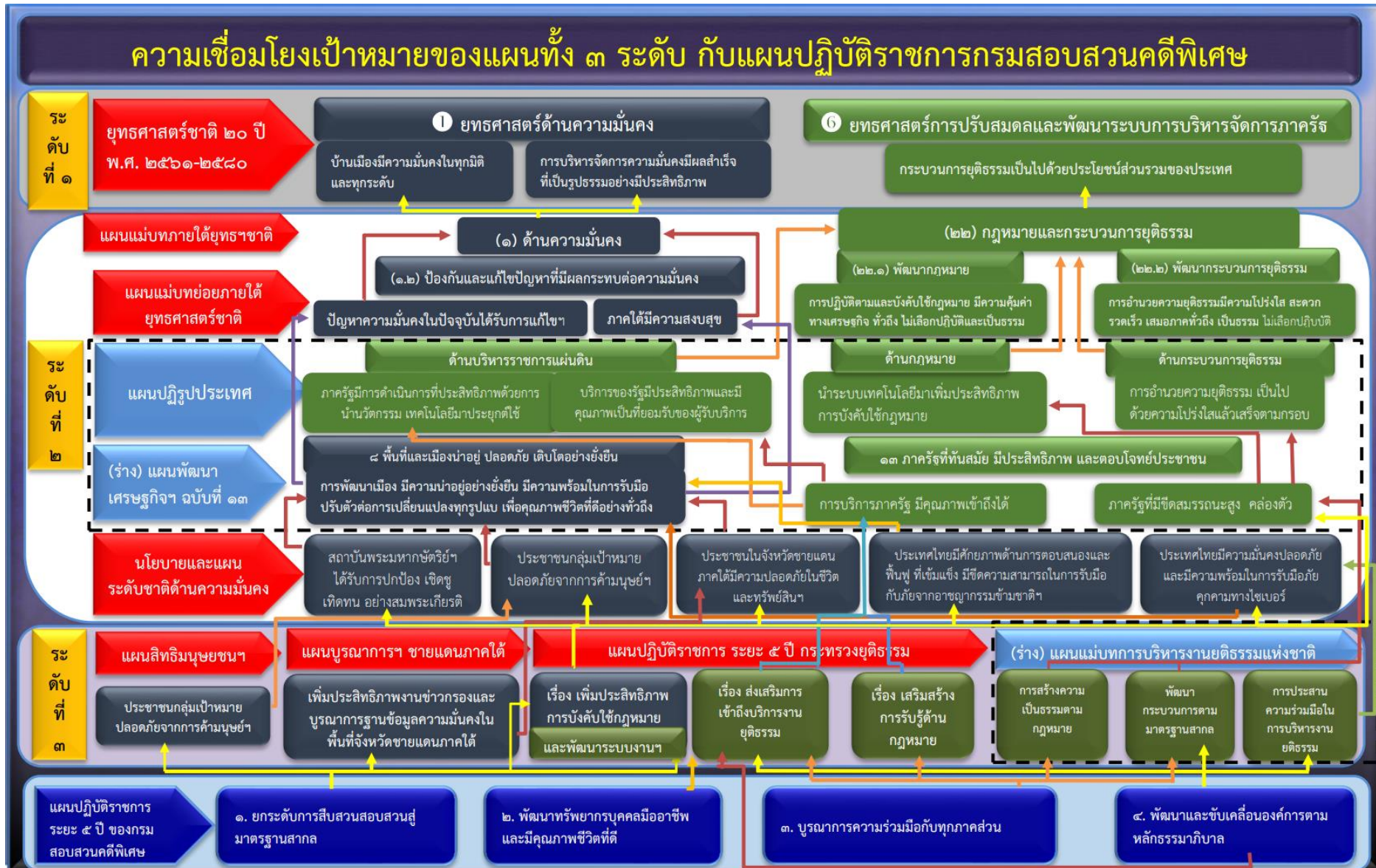
แผนภาพที่ ๑ : ความเชื่อมโยงเป้าหมายของแผนทั้ง ๓ ระดับกับแผนปฏิบัติการการกรมสอบสวนคดีพิเศษ