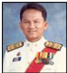
นายสมศักดิ์ เทพสุทิน รัฐมนตรีว่าการกระทรวงยุติธรรม รองประธานกรรมการคดีพิเศษ