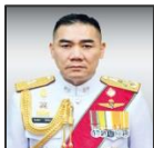
พลตำรวจเอก จักรทิพย์ ชัยจินดา ผู้บัญชาการตำรวจแห่งชาติ กรรมการโดยตำแหน่ง