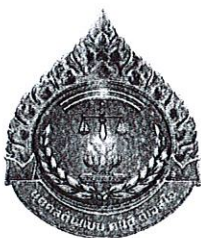
ขนาดเท่าจริง