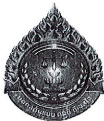
ขนาดเท่าจริง สูง ๓.๒ เซนติเมตร กว้าง ๒.๗ เซนติเมตร