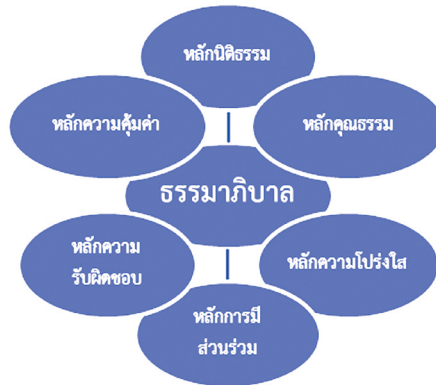
ภาพที่ 2-2 หลักการพื้นฐานของธรรมาภิบาลในการศึกษา เรื่อง ความเชื่อมั่นของสาธารณชนต่อผลงานของกรมสอบสวนคดีพิเศษ