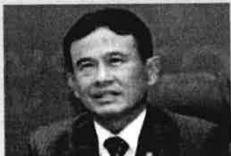
ไพบูลย์ คุ้มฉายา

● ● ● การปราบปรามผู้บุกรุกป่าสงวนแห่งชาติ เป็นนโยบายสำคัญของรัฐบาล พล.อ.ประยุทธ์ จันทร์โอชา หลายพื้นที่ปล่อยปละละเลย จนหมักหมมมาถึงทุกวันนี้ พื้นที่ อ.หล่มเก่า อ.เขาค้อ จ.เพชรบูรณ์ มีการบุกรุกนับหมื่นไร่ ● ● ในวันนี้ (24 มี.ค.) พ.ต.อ.ไพสิฐ วงศ์เมือง อธิบดีกรมสอบสวนคดีพิเศษ มีการกึ่งมาตรวจสอบพื้นที่บุกรุกในเขตอ.หล่มเก่า อ.เขาค้อ จ.เพชรบูรณ์ แต่ติดงานด่วน จึงมอบหมายให้ พ.ต.ท.ประวุธ วงศ์สินธุ์ ผู้บัญชาการ สำนักคดีคุ้มครองผู้บริโภคและสิ่งแวดล้อม กรมสอบสวนคดีพิเศษ เดินทางไปปฏิบัติภารกิจแทน ● ● การบุกรุกป่าสงวน อ.หล่มเก่า-เขาค้อ กรมสอบสวนคดีพิเศษ ดำเนินคดีรีสอร์ท แล้ว 6 คดี เหลือ 2 คดี ที่จะสรุปสำนวนส่งอัยการได้ ถือได้ว่าเป็นอีก 1 ภารกิจของดีเอสไอ กับการปกป้องทรัพยากรธรรมชาติ เรียกคืนที่ดินให้กลับมาเป็นของรัฐ ● ● ชาวบ้านกำลังเดือดร้อนจากปัญหาหนี้ในระบบ ซึ่งกำลังระบาดหนักในหลายพื้นที่ของประเทศ ชาวบ้านเดินทางมากที่กระทรวงยุติธรรม ร้องขอให้รัฐมนตรียุติธรรม พล.อ.ไพบูลย์ คุ้มฉายา ช่วยพวกเขาที่กำลังเดือดร้อนขอให้ศูนย์ช่วยเหลือลูกหนี้และประชาชนที่ไม่ได้รับความเป็นธรรม กระทรวงยุติธรรม ช่วยเหลือ ที่ผ่านมามีศูนย์ช่วยเหลือลูกหนี้ เข้าไปเป็น คนกลางเจรจาไกลเกลี่ยหนี้ที่จ.ขอนแก่น ช่วยผู้มีรายได้น้อย สำเร็จกว่า 100 ราย การช่วยเหลือกรณีล่าสุด “ประกิจ ประทุมชาติ” ที่นำศพพ่อมาประท้วงที่ทำเนียบรัฐบาล ขอให้นายกรัฐมนตรีช่วย หลังที่ดินที่นำไปค้ำประกันเงินกู้ ถูกนายทุนยึดที่ดินไป จำโดนฟ้องขับไล่ออกจากที่ดิน ศูนย์ลูกหนี้ฯ ช่วยเจรจาสำเร็จ เจ้าหนี้ยอมรับเงิน 3.5 ล้าน แลกกับการคืนที่ดินมูลค่ากว่า 15 ล้าน