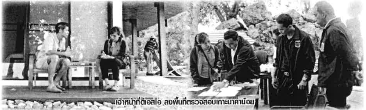
เจ้าหน้าที่ดีเอสไอ ลงพื้นที่ตรวจสอบเกาะนาคาน้อย

ป ัญหาการออกเอกสารสิทธิมีขอบมิให้เห็นอยู่บ่อยครั้งโดยเฉพาะในพื้นที่ป่าของรัฐ ที่ตกเป็นเป้าหมายเพราะความสมบูรณ์ สายงามของที่ดิน แทนที่จะสงวนไว้เพื่อสาธารณประโยชน์ส่วนรวม บางกลุ่มกลับต้องการครอบครองเป็นสมบัติส่วนตัว เช่นเดียวกับกรณีที่เกิดขึ้นที่เกาะนาคาน้อย จ.ภูเก็ต